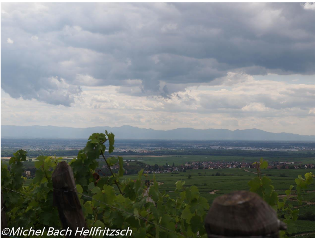
Mittelwihr og Bennwihr med Colmar og rhinsletten i baggrunden.